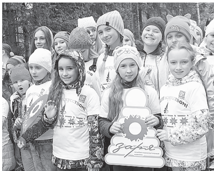
В лагерь приехали юные певцы, музыканты, художники, хореографы.