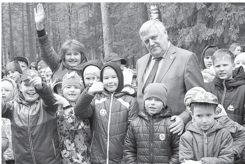
Первую смену «ДыШИ искусством!» открыли при участии депутата Госдумы РФ Александра Василенко.

Ученики и педагоги ДШИ № 2 продолжают занятия и репетиции в санаторных условиях